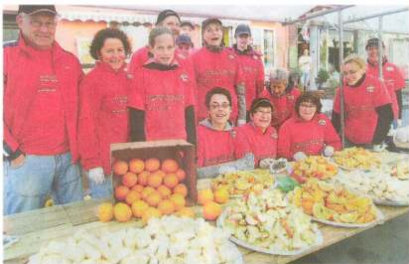
Kiloweise Äpfel, Orangen und Bananen: Das Team vom Laufftreff Hepstedt/Breddorf an der Verpflegungsstelle in der Stader Straße.