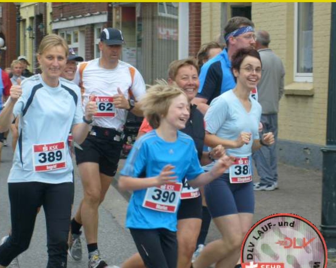
Halbmarathon in Otterndorf