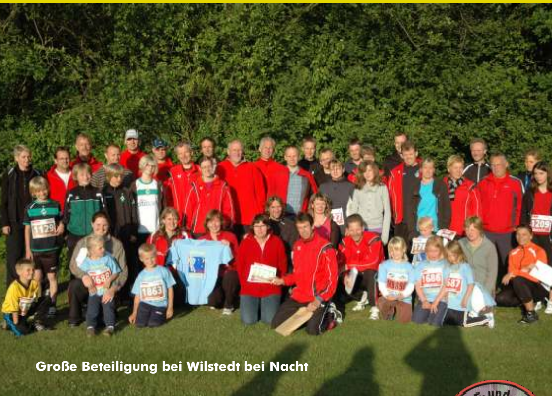
Große Beteiligung bei Wilstedt bei Nacht