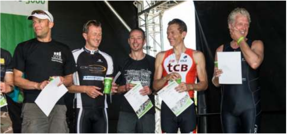
Nehlsen Triathlon am 07.07.2013 in Bremen/ Grambke

Während meine Sportkameraden mit dem Radel nach Kutenholz unterwegs waren und da sehr erfolgreich ihre Runden liefen, machte ich mich auf den Weg nach Bremen Grambke, wo auch die Bremer Landesmeisterschaften im Sprint Triathlon ausgetragen wurden.